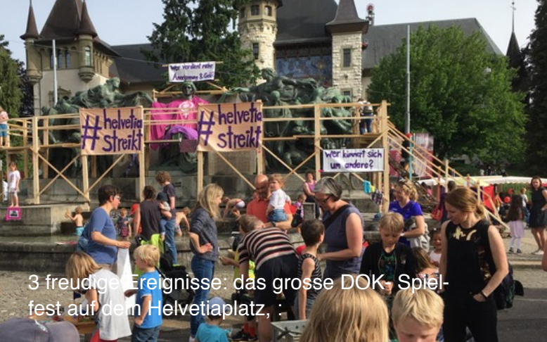
3 freudige Ereignisse: das grosse DOK-Spiel-fest auf dem Helvetiaplatz, :