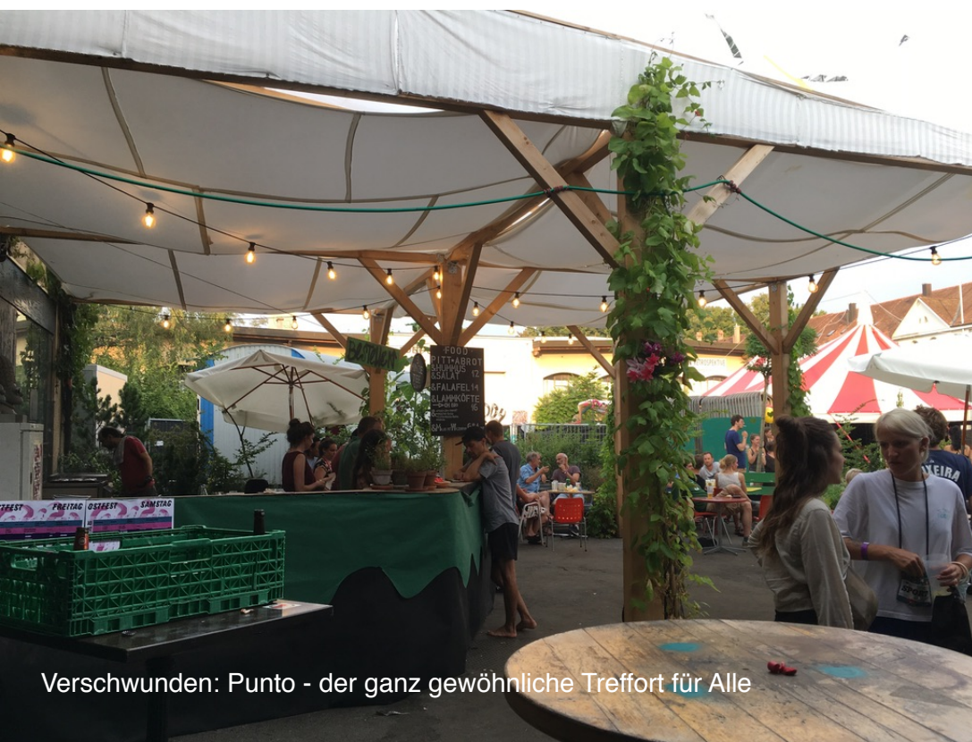
Verschwunden: Punto - der ganz gewöhnliche Treffort für Alle

Im gesitteten Rahmen unseres Stadtteils wirkt das Titelbild provokativ. Ein Squatter auf dem Areal des Tramdepots, ein ohne Bewilligung gebastelter Wohnbau, was soll das?? Da könnte ja jede/r kommen - wir anderen bezahlen schliesslich auch für unsere Wohnungen... Stimmt. und trotzdem - was in der letzten Phase rund um den vor 22 Jahren eingerichteten Quartiertreff Punto entstanden ist, war einfach nur erfrischend und ist - gerade weil so untypisch