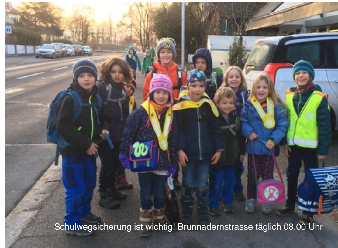
Schulwegsicherung ist wichtig! Brunnadernstrasse täglich 08.00 Uhr

alle Fotos mit Erlaubnis der Betroffenen / schä