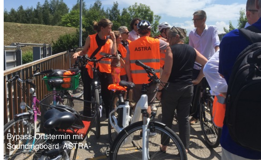
Bypass-Ortstermin mit Soundingboard ASTRA-

zung von Tempo 30 auf Elfen- und Brunnadernstrasse; Das Tiefbauamt der Stadt Bern hat Ende 2018 beim Kanton ein Gesuch zur Einführung von Tempo 30 auf Elfen- / Brunnadernstrasse mit provisorischen Massnahmen (Signalisierung und Markierung) eingereicht. Das Gesuch wurde bewilligt. Am 16. Januar 2019 wurde die Verkehrsbeschränkungsverfügung zur Einführung von Tempo 30 - Massnahmen im «Anzeiger» publiziert. Gegen diese Verfügung sind drei private und eine Beschwerde des TCS eingegangen. Bei den sozialen The