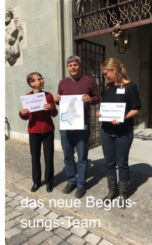
das neue Begrüssungs-Team