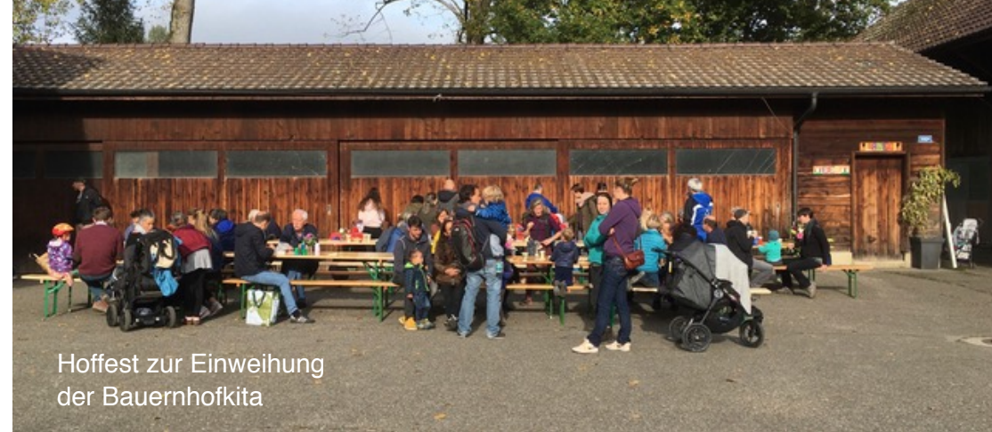
Hoffest zur Einweihung der Bauernhofkita