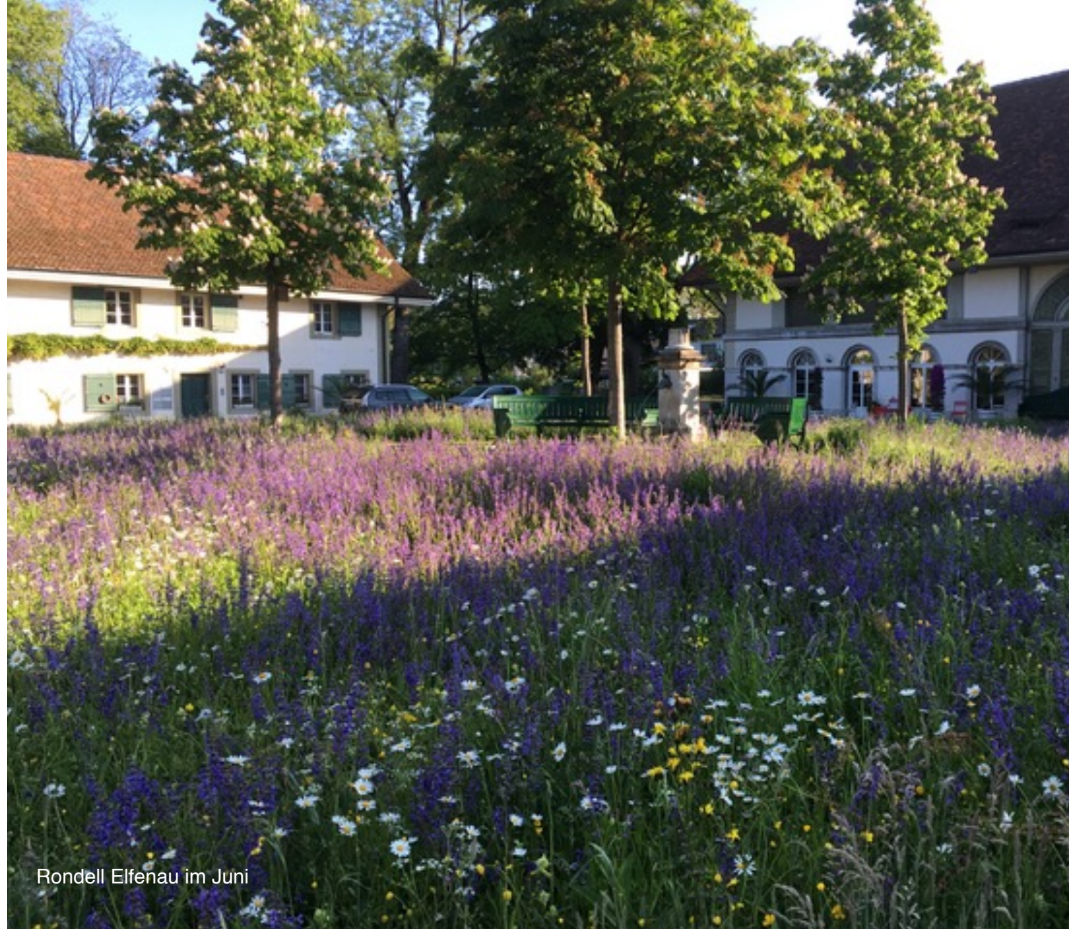
Rondell Elfenau im Juni