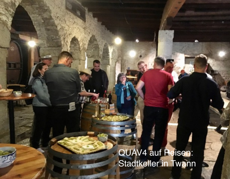
QUAV4 auf Reisen: Stadtkeller in Twann