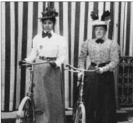
Auf der Schwelle zur Moderne: zwei verwegene Damen anno 1898.