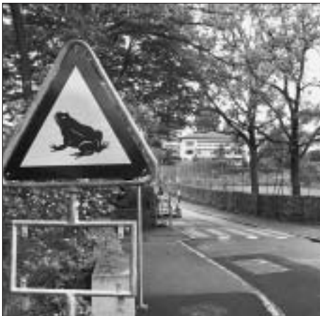
Gefährlicher Übergang beim Egelsee.