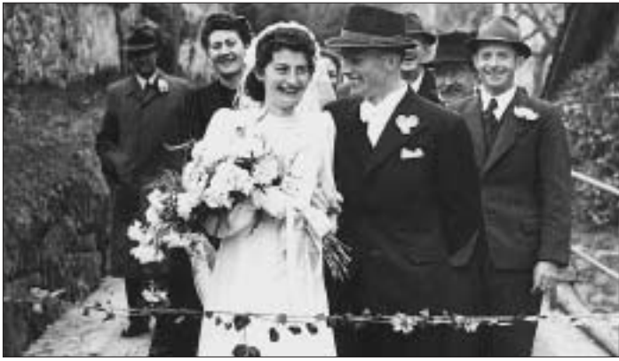
Übergang in einen neuen Lebensabschnitt: Meine geliebten Grosseltern Anfang der 40iger Jahre.