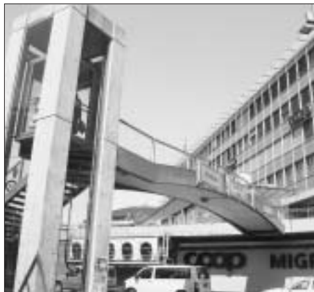
Übergang an einem der hässlichsten Unorte des Stadtteils.