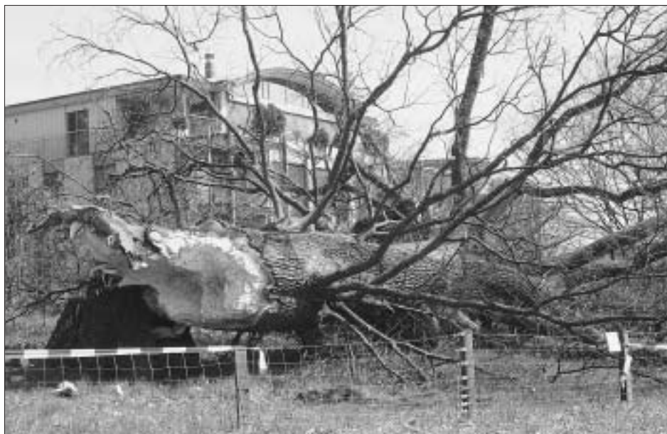
Pilzbefall von den Wurzeln aus; Bruchstelle am unteren Stammbereich.