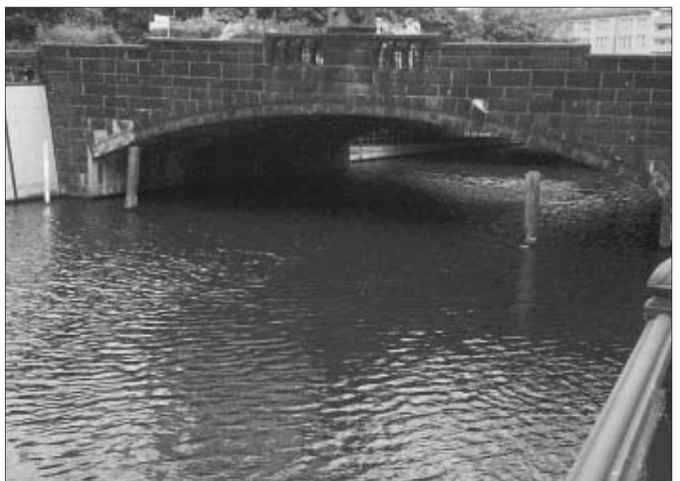
Selbstgewählte Übergänge. Gerechtfertigt?