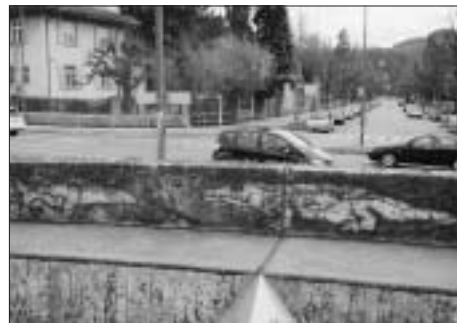
Am Krokodilgraben: Kein direktes Durchkommen vom Gymnasium Kirchenfeld zum Dählhölzli.