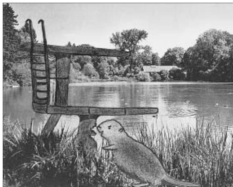
Gefahr für den Egelsee! Die Biber schrecken vor nichts zurück. Bereits ist der neue Sprungturm angelegt!