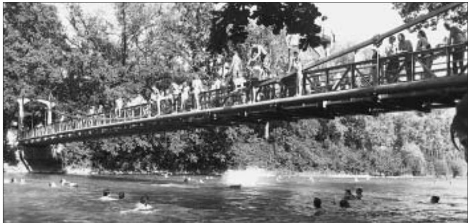
Doppelter Übergang: über die Aare – in die Aare (im Sommer).