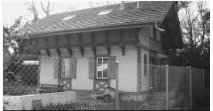
Ehemaliger Bahnübergang: Hier kreuzte bis 1912 die Bahnlinie Bern – Thun die Bolligenallee à niveau. Der Bahnwärter in diesem Häuschen musste bei Zugsdurchfahrten die Barrieren bedienen.