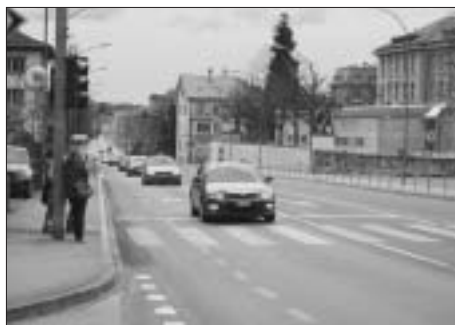
Die Passanten müssen sich gedulden. Der Zugang zum Quartier hinter der Kirchenfeldstrasse ist umständlich.