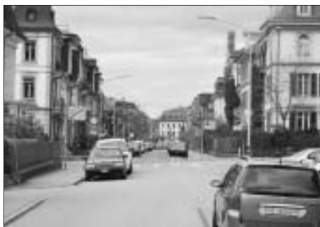
Ruhiges Quartiersträsschen? Hinter dem Stopp-Schild quert die starkbefahrene Kirchenfeldstrasse!