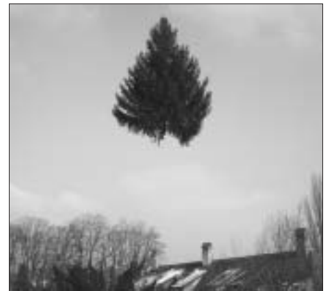
Seltenes Naturschauspiel: am 27. März überflog eine Tanne den Stadtteil IV.