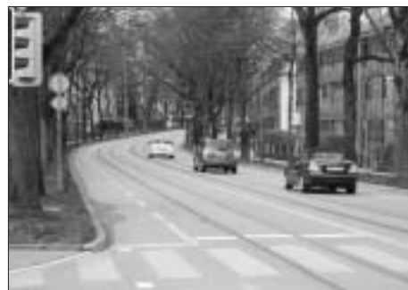
Die Muristrasse (hier) und der Ostring isolieren das Murfeldquartier. Die Übergänge sind schmal.