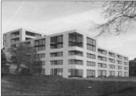
Das projektierte Gebäude.

Bis Herbst 2012 sollten alle Wohnungen bezugsbereit sein. (pb)