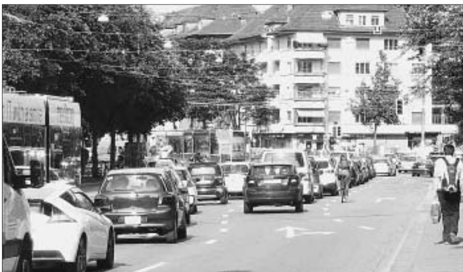
Thunstrasse: Verbesserungen sind dringend nötig.