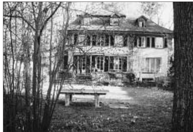
Der Garten bietet Gelegenheit für Entspannung sowie körperliche Betätigung.