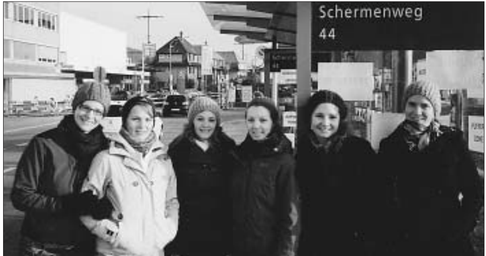
Die Autorinnen der Projektarbeit bei der Präsentation am 3.3.2011.

Viel Zündstoff bietet die künftige Nutzung des Geländes. Da kochen die Emotionen hoch! Die Bevölkerung weiss, dass zwei Naturrasen-Spielfelder entstehen sollen. Die sind unbestritten. Was aber ist sonst noch geplant? Wird