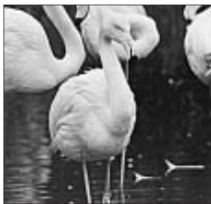
Flamingo-Weibchen Nr. 110.

Während die Ägypter bereits mehr als 2000 Jahre vor Beginn unserer Zeitrechnung Antilopen, Gazellen und Strausse in Tiergärten hielten, entdeckten Adlige in Europa erst im 15. Jahrhundert ihr Interesse an Tierparks. Die damaligen Herrscher stellten vor allem anhand exotischer Tiere in Prunkbauten (siehe