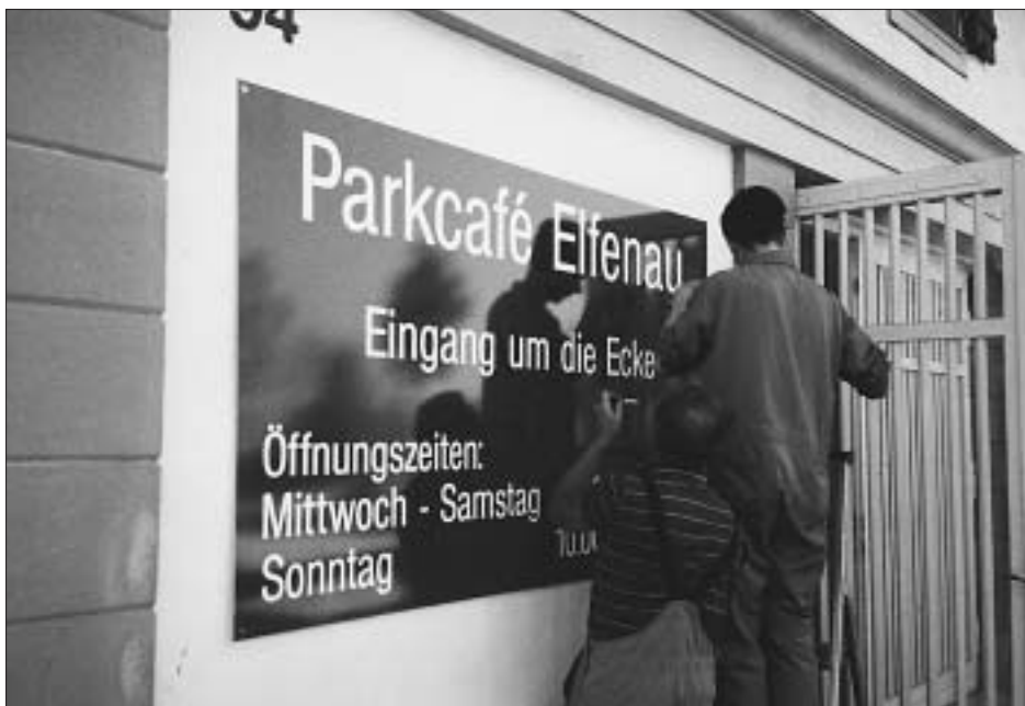
Öffnungszeiten: Mittwoch bis Samstag, 11.00–21.00 Uhr; Sonntag, 10.00–18.30 Uhr.