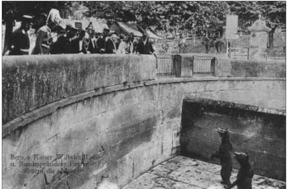
Kaiser Wilhelm II, Bundespräsident Forrer und Gefolge füttern die Bären im Bärengraben, 6. September 1912.

Danach fuhren der preussische Monarch und der eidgenössische Magistrat mit dem weisen Bart im offenen zweispännigen Landauer durch die festlich geschmückten Strassen der Bundesstadt. Dabei wurde das Münster besucht und eben auch der Bärengraben. Dort kamen die beiden Bären in den Genuss, von der «Allerhöchsten Person» gefüttert zu werden. Wie das Foto zeigt, waren sich die Mutzen der historischen Bedeutung des Momentes bewusst und machten brav «ds Mändli» bzw. standen stramm. Ob sich seine Majestät zur militärischen Haltung der Bären lobend geäussert hat, darüber schweigen die Quellen. So rasch wie er gekommen war, so rasch verliess der teutonische Regent mit dem hoch-