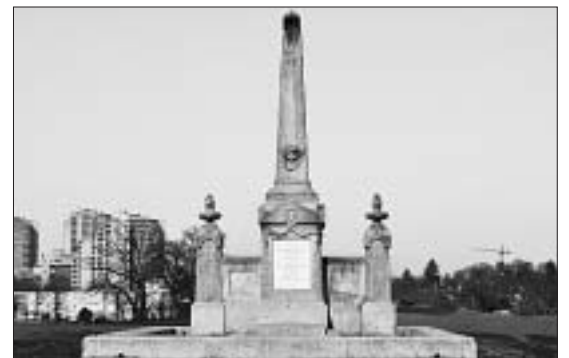
Wie heisst die 1898 verstorbene Dame, die eine Stiftung für soziale Zwecke gegründet hat? Dieser Epitaph ist ihrer Familie und ihr gewidmet.

Tragen Sie die Lösung auf dem Talon unten ein (auch unter www.quavier.ch möglich). Wir verlosen 10 Preise. Einsendeschluss ist der 17. August 2011 . Vergessen Sie nicht, Ihre Adresse und den gewünschten Preis anzugeben. Die GewinnerInnen werden schriftlich benachrichtigt und ihre Namen in der nächsten QUAVIER-Ausgabe publiziert. Viel Glück!