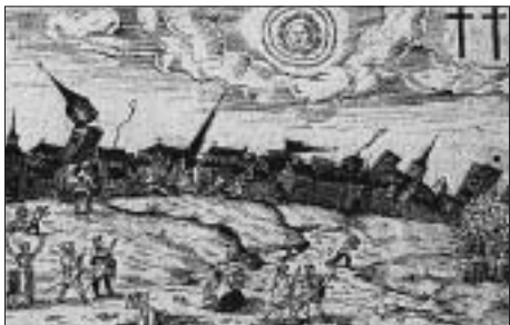
Erdbeben im Mittelalter (1372).

Professor Forster sass im Büro seines Observatoriums auf der Grossen Schanze und schrieb einen Brief, als er unversehens einen heftigen Erdstoss verspürte, dem eine deutliche Seitenverschiebung folgte. «Von der Decke lösten sich kleine Gypsstücke»; die Messgeräte «traten sofort in Function und lösten das electriche Alarmwerk aus». Eine Assistentin, welche im obern Stockwerk gerade dran war, kniend die