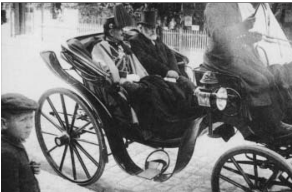
Kaiser Wilhelm II und Bundespräsident Forrer im Landauer beim Bärengraben, 6. September 1912. In der Elfenau wurde eine Strasse nach Ludwig Forrer (1845–1921) benannt.