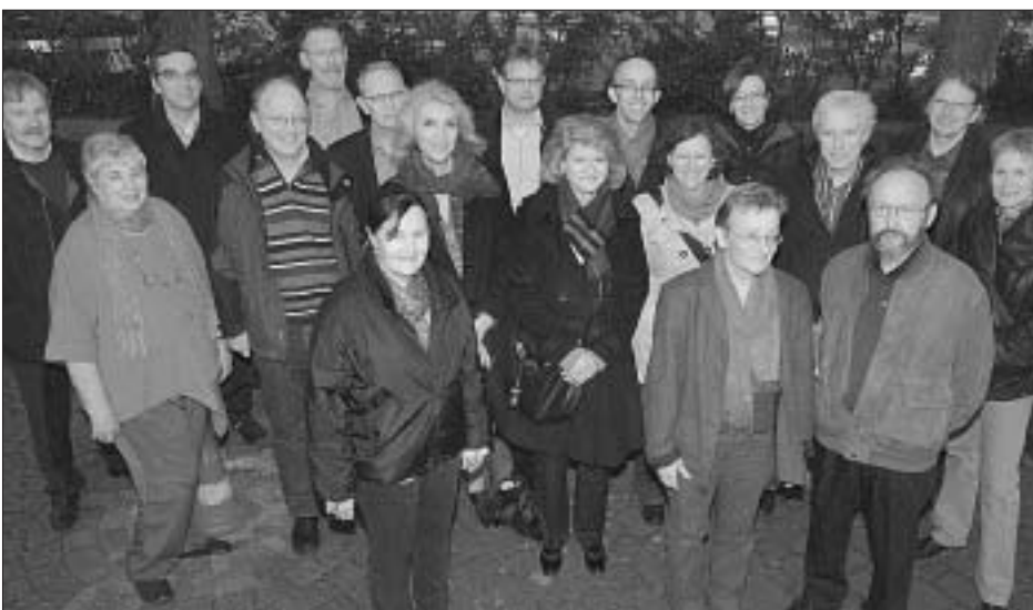
Die QUAV 4.

Die neue Überbauung schafft ein vielfältiges Wohnangebot mit 61 grossflächigen Woh-