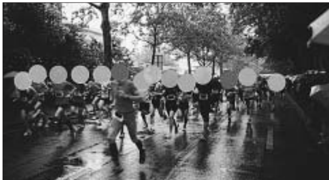
Papiermühlestrasse. Rechts: Stadtteil IV.

Nein, kein Vorort von Zürich. – «Idiotikon» heisst das Wörterbuch der schweizerdeutschen Sprache. Der Name stammt aus dem Griechischen: «Idiotes» meint laut Lexikon den Privatmann, den einzelnen Bürger oder gewöhnlichen Menschen, aber auch den «Laien, Nichtswisser, Stümper, Pfuscher» (Frauen nicht mitgemeint, sondern unbeachtet). Ziemlich dünnkelhaft, diese alten Griechen! – Das Idiotikon erfasst die Sprache des einfachen Volkes. Die Sammlung