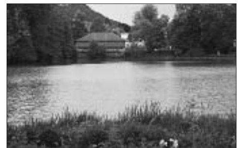
Stille Wasser gründen tief.

Damit die Freude am Egelsee erhalten bleibt und auch künftig niemand vor den «unergründbaren Tiefen» dieses Weiher's Angst haben muss, sei zum Schluss noch darauf hingewiesen, was das Adressbuch von 1836 weiter zu vermelden hatte: «[es] ergab sich nach genauer Sondierung durch glaubwürdige Männer die höchste Tiefe nicht über 15 bis 20 Fuß.» (rt)