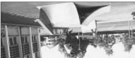
Sogar das Bild steht Kopf!

.erschrecken Schulbildung mit niemanden wollen wir Aber .bereist Welt halbe die seinerzeit doch er hat ,wissen ja es muss der Und .das sagt Goethe ,Nun ?liegt nah so Gute das doch wenn ,muss schweifen Ferne die in man dass ,denn sagt Wer – Art dieser Ferien für haben Gelegenheit oder Geld ,Zeit Menschen alle nicht dass ,davon Abgesehen ... Nein ?Alle ... mal Moment Aber .Sonne die an Wochen paar ein für verschwinden und Flugzeug erstbeste ins steigen ,Koffer ihre packen Menschen Alle .beginnen Herbstferien die und ,September es ist Bald