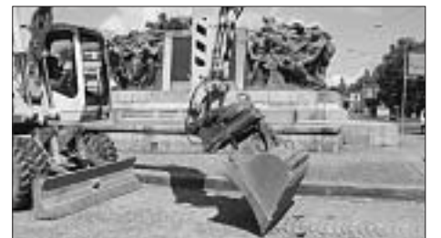
Wie heisst der Schöpfer dieses Denkmals?

Tragen Sie die Lösung auf dem Talon unten ein (auch unter www.quavier.ch möglich). Wir verlosen 10 Preise. Einsendeschluss ist der 4. November 2009 . Vergessen Sie nicht, Ihre Adresse und den gewünschten Preis anzugeben. Die GewinnerInnen werden schriftlich benachrichtigt und ihre Namen in der nächsten QUAVIER-Ausgabe publiziert. Viel Glück!