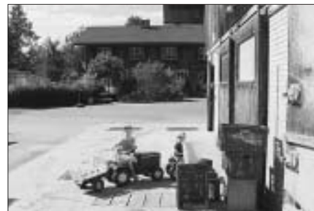
Der Bauernhof als Kinderspielplatz.

Die wirtschaftliche Lage des Bauernhofs in der Elfenau ist prekär. Infolge des schlechten Gebäudezustands können die Tierschutzvorschriften nicht mehr eingehalten werden (die Schweinehaltung musste bereits eingestellt werden), und der Betrieb ist ohne Zusatzeinkommen des Pächters nicht mehr zu führen.