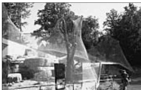
Die Leopard-Anlage im Tierpark.

Die einzige territoriale Erweiterung seit seiner Gründung erfuhr der Tierpark denn auch