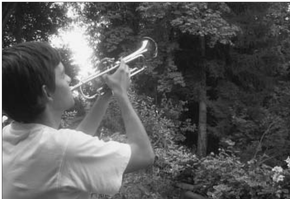
Kehrseite des stillen Quartiers: Dieses Bild musste gestellt werden.