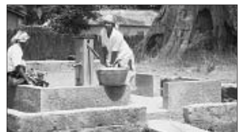
Trinkwasser vom Grundwasser-Brunnen.