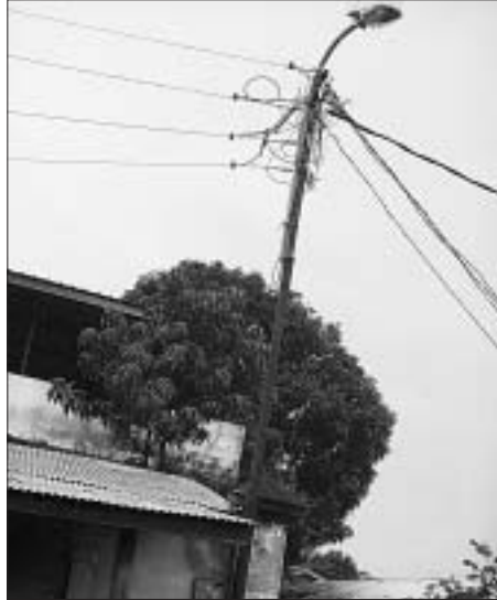
In Conakry gibt's manchmal Strom.

... «Wir ticken einfach komplett anders als tout le monde hier ... Da fegte am Samstag nachts ein krasser Sturm über Kissidougou. An Schulen, Kirchen und Privathäusern flogen Teile der Wellblechdächer davon. Dies muss nun vor der Regenzeit noch geflickt werden. Aber die meisten Männer sind in ihre Dörfer gereist, um die Felder zur Pflanzung vorzubereiten, und das verfügbare Geld wurde bereits für das Saatgut ausgegeben. Woher kriegt man einen Vorschuss, um den Dachdecker zu bezahlen? Denn kaum jemand hat das nötige Werkzeug