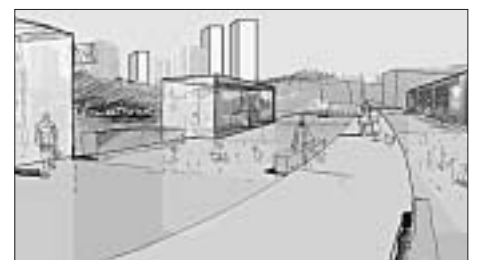
Planstudie Überdeckung Sonnenhof.

Die «Vision» der neuen unterirdischen Ost-Umfahrung von Bern ist ein Bundesprojekt. Falls dieses Projekt realisiert wird, ergeben sich daraus interessante und grosszügige zusätzliche Entwicklungsmöglichkeiten im Quartier, weil dann die heutige Autobahn zurückgebaut werden kann. Eine erste Studie, welche dem Begleitteam schon präsentiert wurde, zeigt die Potenziale auf. Welche dieser Potenziale in welcher Form in die Quartierplanung aufgenommen werden, ist Gegenstand der anstehenden Planungsarbeiten. (pb)