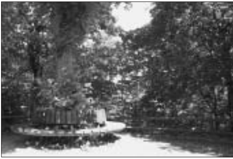
Aussichtspunkt Engl. Anlagen, heute.

schätzung und Schutz» stehen im Vordergrund.