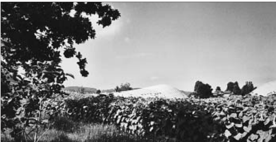
6. Muschel, Salzberg, Wanderdüne? Welchen Namen trägt das Objekt im Zentrum des Bildes?