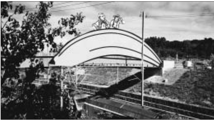
Bananenbrücke – Nervenstrang zwischen der Welt der Waldau und dem Rest des Stadtteils IV.

Bin ich richtig hier? QUAVIER? Ja? Na dann, hallo! Gestatten Sie, dass ich mich vorstelle: Füller, Fritz Fürchtebald Füller, Ihr neuer Kolumnist – frisch angekommen aus Deutschland, sozusagen hereingeschneit, mitten im Hochsommer. Fühle mich mächtig stolz, für Ihre Qualitätsquartierzeitung schreiben zu dürfen. Und dass ich dafür nicht den Inseratentarif zu zahlen brauche, sondern gratis darf! – Mitgebracht hab'ich meinen GROSSEN DUDEN sowie 2'345 Überstunden aus früherer Tätigkeit beim Kanton BE. Berndeutsch in Wort und Schrift versteh'ich leidlich.