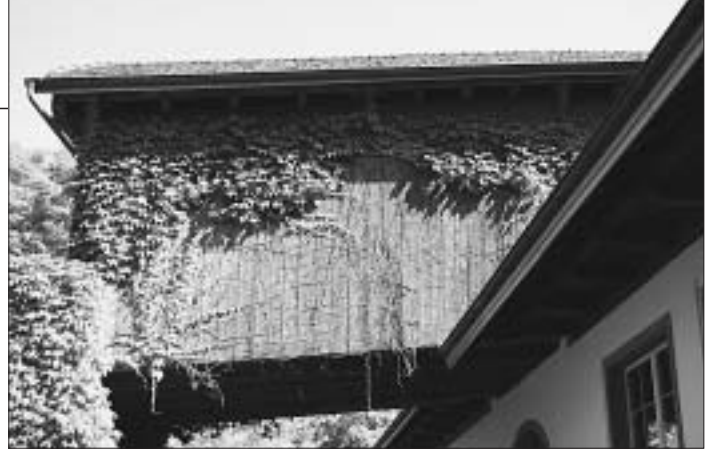
1. Diese ehemalige Heubühne dient heute als Lagerraum der Stadtgärtnerei. Zu welchem Gebäude gehört sie?

Alles hat zwei Seiten. Mindestens! – Wir promenierten durch den Stadtteil IV auf der Suche nach andern Ansichten. Und kehrten mit ein paar Bildern zurück. Wo waren wir? (Lösungen auf Seite 26). Ideen, Text und Fotos: rt,kw,vk,ar