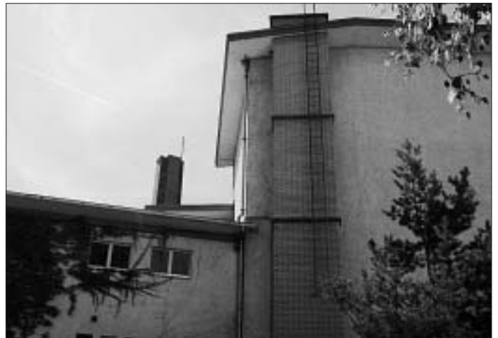
3. Fabrik oder was? Wie heisst dieses Gebäude am berühmten Kreisel?