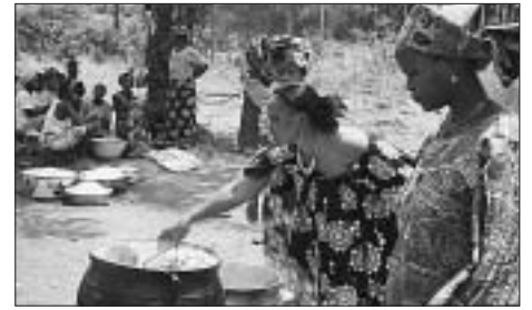
Konferenzküche, Essen für 300–400 Teilnehmende.

... «Alle möglichen Themen sprechen wir in unseren Seminaren an, auch Familienbudget und Familienplanung, Kindererziehung und Kommunikation, maîtriser soi-même ... Die Männer fühlen sich oft bedroht von den Neuerungen; die Frauen schöpfen Hoffnung. Sie sind auch sehr interessiert am Wohl der Familie, der Kinder. Und sie arbeiten von früh bis spät.»