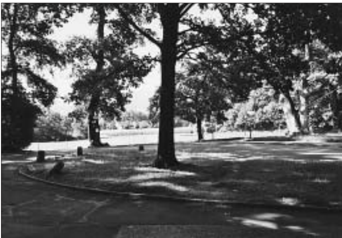
4. Beinahe die lieblichste Kehrschleife Europas! Nach welchen Fabelwesen ist die Bus-Endstation benannt?