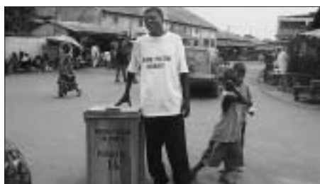
Kissidougou führt öffentliche Abfallkübel ein.