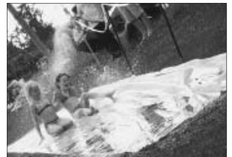
Nass und heiss begehrt: die Wasserrutsche – das Highlight des Festes.