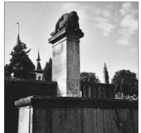
7. Welcher Halle wendet die Dame ihre Rückseite zu?