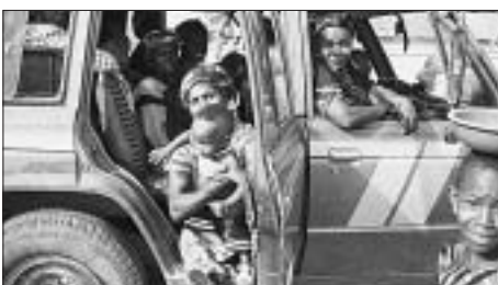
Taxi, noch nicht voll besetzt!