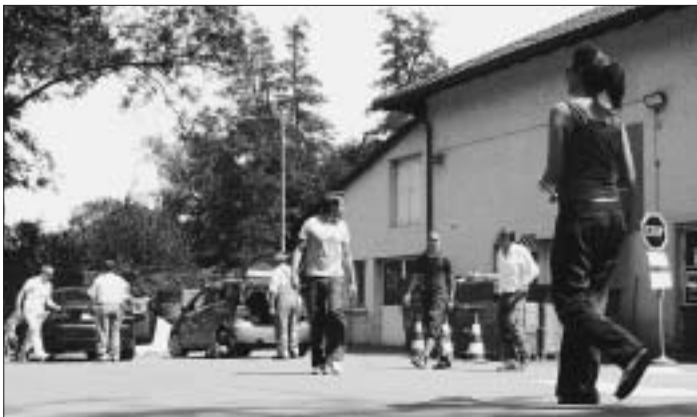
Reger Betrieb im Entsorgungshof: Im Jahr werden hier pro Kunde circa 30 Kilo Alt- bzw. Neuwaren verschrottet.

Rechtlich lässt sich das so begründen: Wenn der Überbringer auf sein Eigentum verzichtet (Zivilgesetzbuch, Art. 729), kann die Stadt als Betreiberin des Entsorgungshofs über die nun «herrenlosen» Gegenstände verfügen. Sie könnte die Sachen allfälligen Interessenten, die sie weiterverwenden wollen, sogar gratis zur Aneignung überlassen (Art. 718 ZGB). (ar)