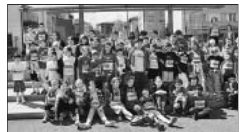
60 TeilnehmerInnen des GP Bern Team Manuelschule, 2.-4. Klasse.