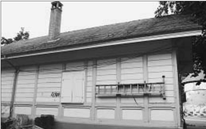
2. Auch Bern hat seinen «Grand Palais». Bei welchem Platz?