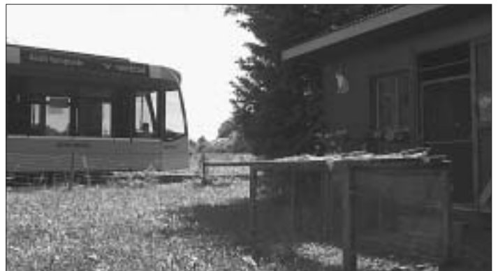
5. Bei diesem Chüngelisteall kehrt Tram Nr. ... ?