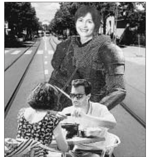
Immer kühner: Aussenbestuhler mitten auf der Thunstrasse!