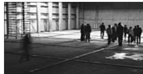
Dereinst wandeln hier Kunstliebhaber: der 1000 m² grosse Wechselausstellungsraum.