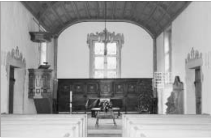
7. In dieser Kapelle finden jährlich rund 10 Konzerte statt, für PatientInnen und MitarbeiterInnen der nahen Klinik, aber auch für alle interessierten MusikliebhaberInnen. Wie heisst die Kapelle und zu welcher universitären Klinik am Rande unseres Stadtteils gehört sie?