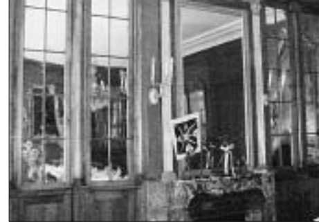
Innen: der Spiegelsaal.

Mitglied der «wohladeligen Flitzbogengesellschaft» konnte nur werden, wer einer bernischen Zunft angehörte. Noch heute ist die Bogenschützengesellschaft – wie sie uns freundlicherweise mitteilt – eine geschlossene Gesellschaft. Sie umfasst nur 20 bis 30 Mitglieder und ergänzt sich jeweils «durch Kooptation». Sie hat einen «König»; er wird jährlich durch Schiessen auf einen hölzernen Papageierkoren. Ihm zur Seite stehen ein Statthalter, ein