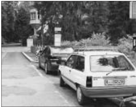
Die Zugangssituation Helvetiaplatz – Englische Anlage ist unbefriedigend.

Die Analyse der Nutzungsarten hat folgende Schwerpunkte: