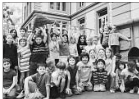
Die Gewinner des «Goldenen Besens».

Im Rahmen der Kampagne «Subers Bärn – zäme geits!» hat die Direktion für Tiefbau, Verkehr und Stadtgrün die Primarschule Kirchenfeld mit dem «Goldenen Besen» ausgezeichnet. Mit dem Preis wird verantwortungsvolles Handeln im Umgang mit Abfällen gewürdigt. Die Pri-