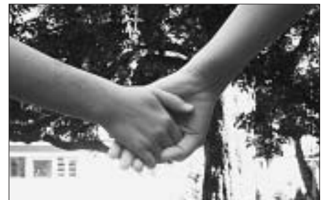
Hand in Hand wird der erste Schultag bewältigt.