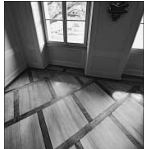
Der quadratierte Fussboden.