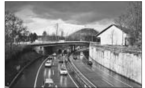
Die aktuelle Ansicht der Autobahn A6 mit der Eishalle im Hintergrund.

Schweissperlen von der Stirn. Welche Form die Planung letzten Endes annehmen wird, bleibt noch unklar; sicher ist jedoch, dass Berner Quartierdelegierte bemüht sind, bestmögliche Lösungswege für anliegende Gebiete und ihre Bewohner anzustreben und sich dabei ganz bestimmt nicht mit der erstbesten Variante zufrieden geben. Mit dem Anbrechen der Pause stehe ich mich schliesslich davon, denn erste Eindrücke ziehen sich meist nicht über Stunden hin, Delegiertenversammlungen aber bekanntlich schon. (jk)