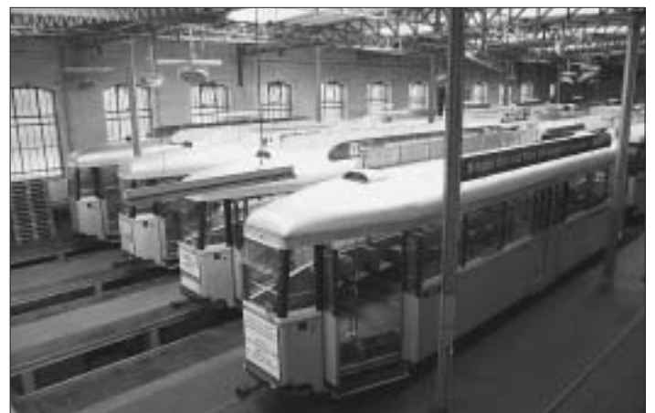
12. 38 Trams warten hier – primär in der Zeit von Mitternacht bis frühmorgens – geduldig auf ihren Einsatz. Mit der Eröffnung der Tramlinie Bern West im Dezember 2010 müssen sie in ein neues Tramdepot zügeln, das ebenfalls in unserem Stadtteil gebaut wird. An welcher Strasse wird das neue Tramdepot liegen? Text und Fotos: vk/pb