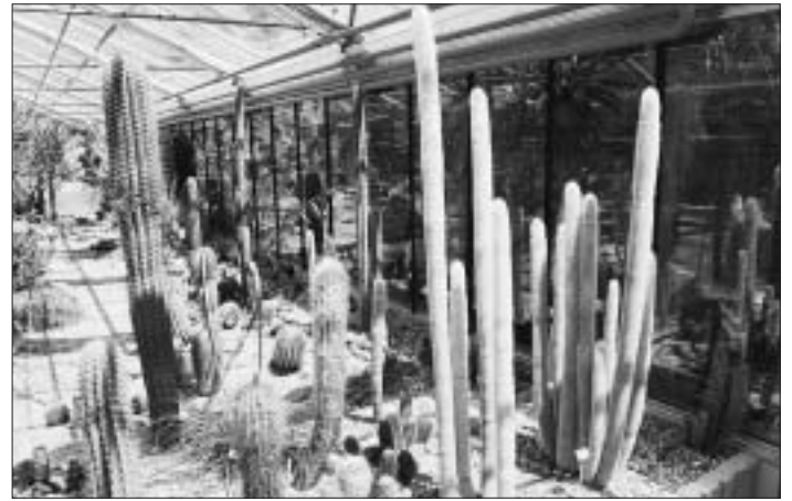
8. Diese Kakteen fühlen sich – angesichts der oftmals herben Temperaturen nördlich der Alpen – nur im Innern eines Hauses wohl. Wo und in welchem Haus kann diese Kakteenvielfalt bewundert werden?