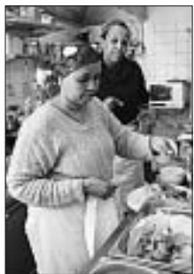
Zwei Köchinnen bereiten ein köstliches Mahl vor.

Das Bleiberecht-Café steht allen Menschen offen. Auch – und gerade – jenen, die sonst nicht an vielen Orten willkommen sind: Aus dem Heimatland geflüchtet – meist aus politischen Gründen – leben Zehntausende von Sans-Papiers, abgewiesene Asylsuchende oder Menschen mit dem unsicheren F-Status in der Schweiz.