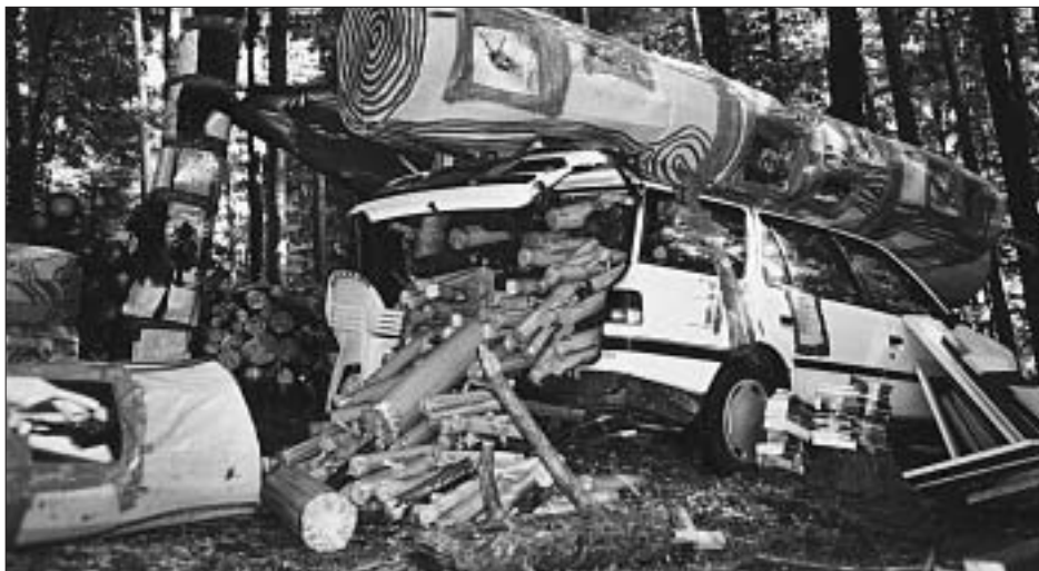
Auf dem Holzweg, von und mit Hirschhorn.

Hirschhorn ist wieder da. Im Auftrag des Klee-Zentrums hat er ein (räumlich gesehen) grosses Kunstwerk geschaffen, « Holzweg » genannt. Nichts Böses ahnend, spazieren Sie am Ostermundigenberg und stossen mitten im Wald auf ein Auto, aus dem jede Menge Plastikstangen herausquellen. Rundherum am Boden verstreut liegen Scheiben aus Holz oder Kunststoff. Spruchbänder und fotokopierte A4-Blätter enthalten einschlägige Texte. Da wird Ihnen zum ersten Mal beziehungsweise einmal mehr bewusst: Ja , tatsächlich, die Menschheit befindet sich auf dem Holzweg! Inklusiv Hirschhorn.