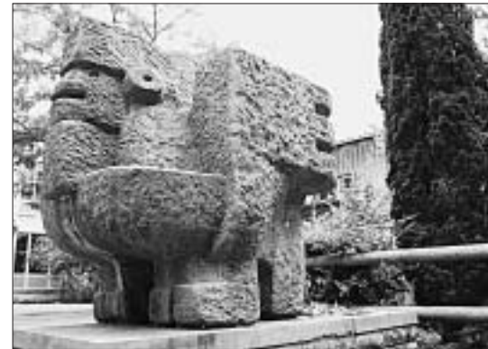
Bei welchem Schulhaus ist diese Skulptur installiert?