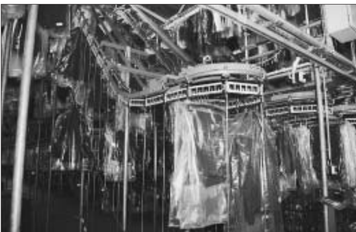
11. Auch die Post benötigt ein Zeughaus, wo sie ihre Ausrüstung lagern kann. Vom Postsack bis zur Uniform des Briefträgers (siehe Foto), von der Computer-Tastatur bis zum Formular: Alles, was die Post in Betrieb und Verwaltung benötigt, ist in ihrem Logistikzentrum aufbewahrt. An welcher Adresse befindet sich das kaum zu übersehende Gebäude?