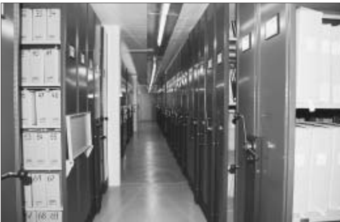
9. Unterirdisch, im Inneren des Bodens, lagern hier 50'677 Laufmeter (Bestand 2007) archivwürdige Unterlagen. Wie heisst die eidgenössische Institution, die sich seit 1899 in unserem Stadtteil befindet – u.a. «dank der Trockenheit und der grösseren Billigkeit des Baugrundes» (Zitat des damaligen Bundesarchivars)?