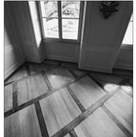
Der quadratierte Fussboden.

– Werner Morlang, «Ich begnüge mich, innerhalb der Grenzen unserer Stadt zu nomadisieren...»: Robert Walser in Bern, Bern 1995