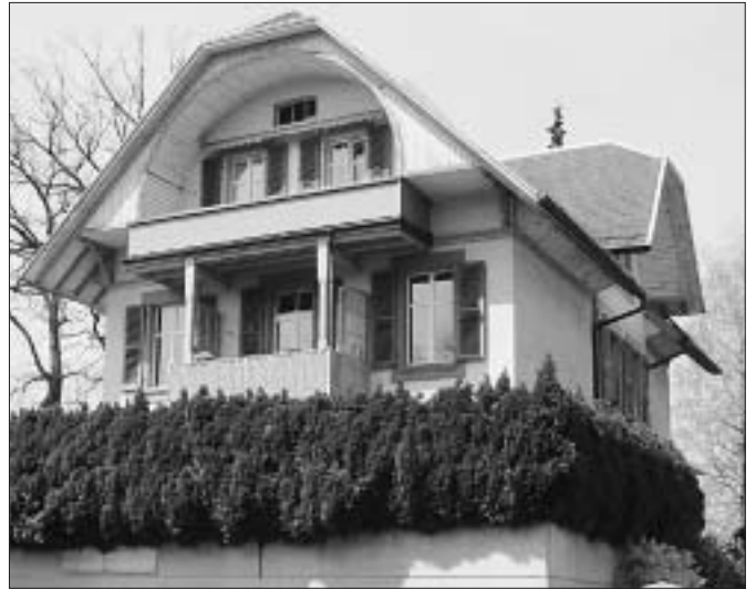
1902 wohnte Einstein ein paar Monate lang im Dachstock der Archivstrasse 8, von wo aus er den herrlichen Blick in die Alpen und auf die Aare genoss.

Archivstrasse 8 – unvergesslicher Abend Ab 14. August 1902 wohnte Einstein fünf Monate lang im Dachstock der Archivstrasse 8. Vom Balkon aus, unter einem Rundgiebel des Chalets, konnte er den herrlichen Blick auf den