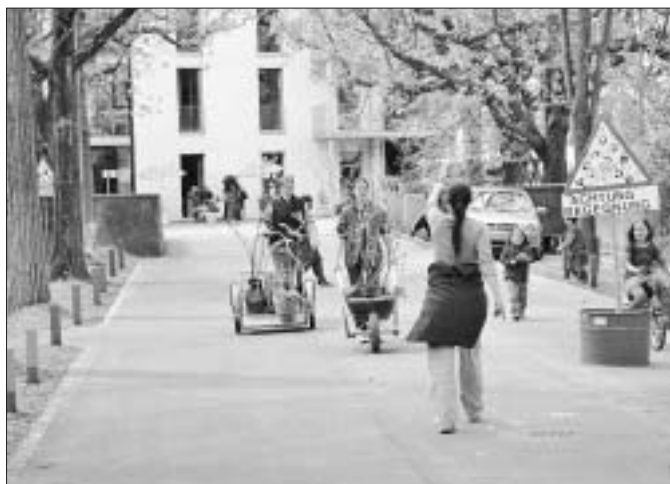
Aktionstage in der Begegnungszone Murifeld.

Die Jugendzone Ost war ebenfalls am Abschlussabend der Projektstage im Schulhaus Sonnenhof anwesend. Mit einem Postenlauf machte die Jugendarbeit auf sich aufmerksam. Auch hier hat sich uns ein neuer Partner erschlossen. Das Pflegen der Beziehungsnetze im Stadtteil bildet nach wie vor einen Schwerpunkt unserer Arbeit.