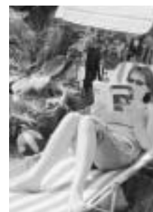
Titelbild: Ferien auf Balkonien oder in Gartanien können sehr erholsam sein.