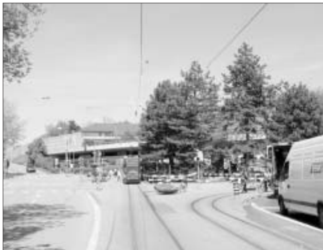
Von welchem Maler hat dieser Platz seinen Namen?

D ieser Platz ist fast rund um die Uhr stark befahren. Nun soll er freundlicher gestaltet werden. Wie heisst der Berner Maler aus der Zeit des Ancien Régime, der diesem Platz den Namen gegeben hat? Wenn Sie den Namen wissen, füllen Sie schnell den Talon aus (auch unter www.quavier.ch möglich). Wir verlosen 10 Preise. Einsendeschluss ist der 17. August 2005 . Vergessen Sie nicht, Ihre Adresse und den gewünschten Preis anzugeben. Die GewinnerInnen werden schriftlich benachrichtigt. Viel Glück!