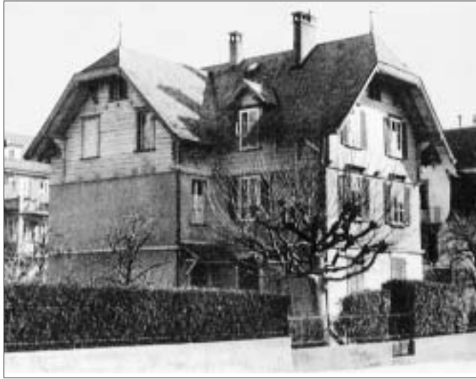
Über drei Jahre lang wohnte die Familie Einstein in diesem Haus an der Aegertenstrasse 53 (steht heute nicht mehr) – bis zum Wegzug nach Zürich 1909. Hier pflegte der Forscher sein Familienleben und wurde von einem Vorprüfer von Patentgesuchen zum Privatdozenten in theoretischer Physik an der Universität Bern.