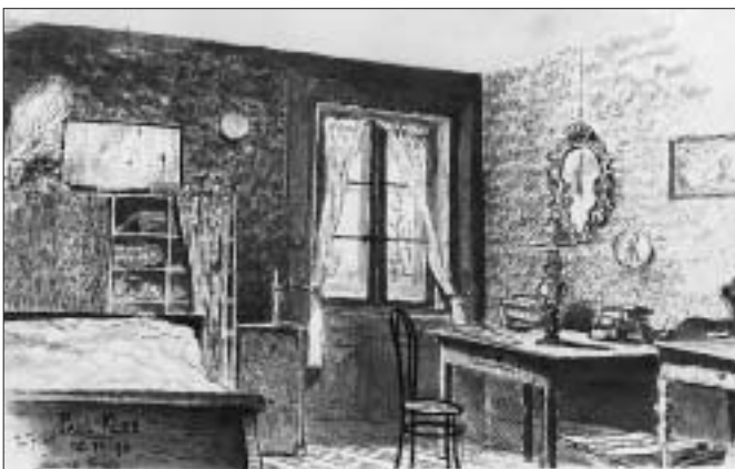
Paul Klee, Meine Bude, 1896, Feder, Pinsel und Bleistift auf Karton, 12,1X19,2 cm. Diese Darstellung entstand während der Zeit an der Marienstrasse 8. Zentrum Paul Klee, Bern