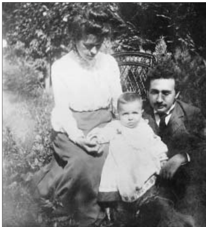
Mileva und Albert Einstein mit ihrem ersten Sohn Hans Albert, Bern 1904.

niedriger gewesen sein als zuvor in der Altstadt. Eine Woche nach seinem Einzug bekam Einstein endlich positiven Bescheid vom Patentamt über sein Stellengesuch als Vorprüfer von Patenten (Jahresgehalt 3'500 Franken). Vor seinem Amtsantritt am 23. Juni konnte Einstein gerade