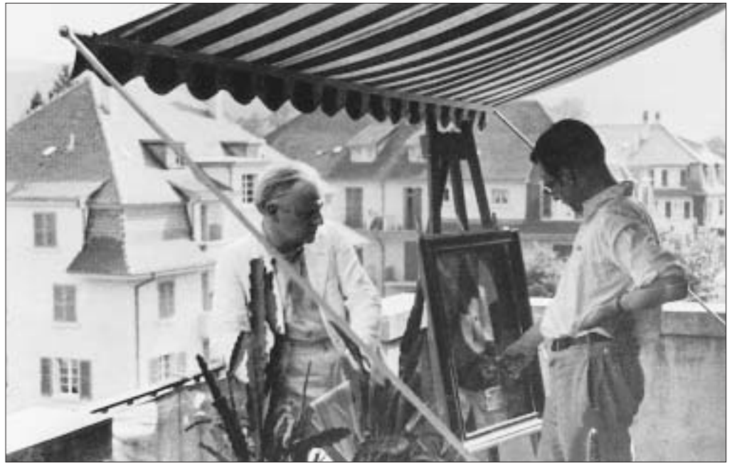
Paul und Felix Klee auf dem Balkon Kistlerweg 6, 1934, auf der Staffelei das Bild «Dynamik eines Kopfes». In dieser Wohnung schuf der Künstler allein 1939 über 1000 Werke.

1897, kurz vor dem Umzug an den Obstbergweg 6, quält Paul Klee die Frage, ob er (als begabter Violinist) Berufsmusiker oder doch lieber Maler werden wolle: «Vor der Sekunda wäre ich gern durchgebrannt, was aber der Eltern Wille verhinderte. Ich fühlte nun ein