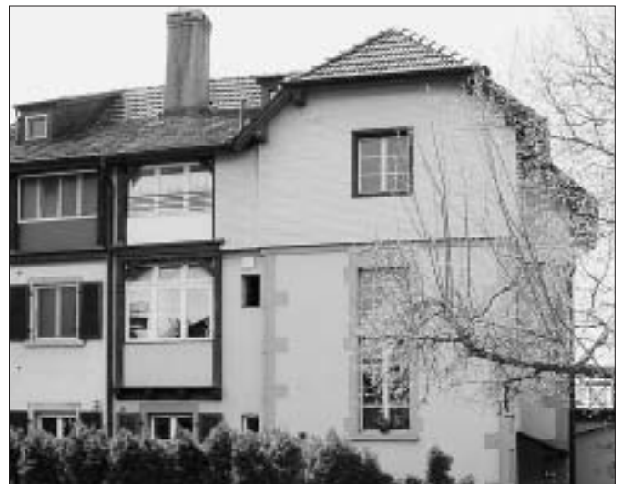
An der Tillierstrasse 18 lebte der Physiker frisch vermählt mit seiner Frau Mileva. Nebst der Aufgabe beim Patentamt trieb er hier seine wissenschaftliche Arbeit voran.