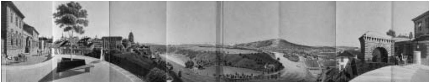
Illustration: Panorama von der Münzterasse über den Stadtteil IV, von Franz Schmid, handkoloriert, um 1840

Das Medium Panorama erlebt heute einen neuen Aufschwung. Durch die digitale Erfassung der Landschaft, durch IMAX und ähnliche Filmformate eröffnen sich faszinierende Zukunftsperspektiven. Der Panoramagedanke an sich geht in seinen Wurzeln zurück bis in die Antike. Zwischen 1790 und 1910 folgte die grosse Blütezeit des Panoramas. Die alpinen Dokumentarpanoramen wurden zu einer kartografischen Spezialität der Schweiz. Das Panorama ist eine All-Ansicht einer räumlichen Umgebung mit einem Öffnungswinkel zwischen 90° und 360°. Durch eine zentral- oder parallel-perspektivische Konstruktion wird erreicht, dass man auf einen Blick mehr sehen kann als mit dem Blickwinkel des Auges von 90° möglich ist. Damit wird ein menschliches Grundbedürfnis nach Übersicht und Orientierung erfüllt. Erstmals gibt eine Ausstellung einen Überblick über die erstaunlich vielen Arten des Panoramas in der Schweiz. Der Schwerpunkt liegt bei der sehr mannigfaltigen Welt der topografischen Panoramen, die häufig in Form von Faltpanoramen veröffentlicht werden.