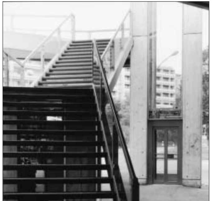
Kennen Sie diesen Platz?

Einsendetermin ist der 20. Februar 2002. Vergessen Sie nicht, Ihre Adresse anzugeben. Die Gewinnerinnen oder Gewinner werden schriftlich benachrichtigt. Viel Glück!