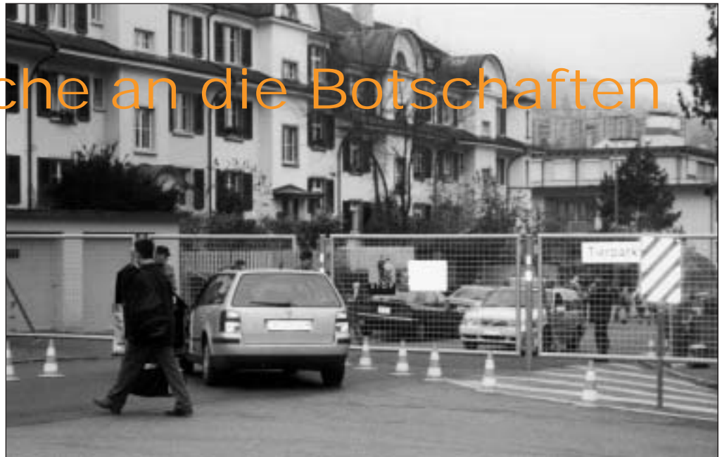
Unten an der Jubiläumsstrasse.

«Botschaften, die ein besonderes Sicherheitsrisiko darstellen, gehören nicht in Wohnquartiere!» A.J.R.