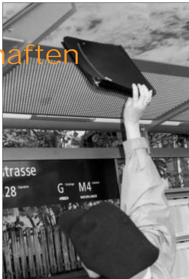
Die Gepäckablage ist etwas hoch geraten.

Meldung 2 (brutal): Ein schwarzes Auto rast heran, bremst scharf ab und hält unmittlerbar neben einem wartenden Tram. Zwei oder drei bullige Typen springen aus dem Auto und stürzen sich auf einen schwarzen Mann, drücken ihn in einen Hauseingang, verbinden ihm die Augen mit einem schwarzen Tuch und schleppen ihn ab. Eine Verhaftung? Abrechnung unter Dealern? Sicher ist nur: Es war nicht Kino, sondern geschah an einem Sonntagabend um sechs. Im Stadtteil IV.