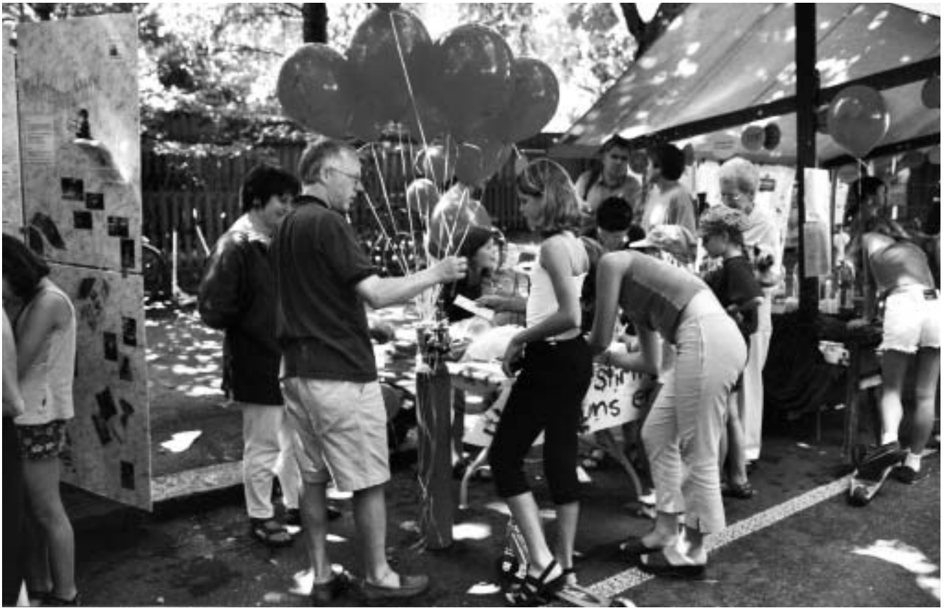
Der Wettbewerb fand grossen Anklang.