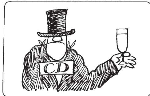
Illustration aus: Ueli der Schreiber: 100mal Bärner Platte, Benteli 1972

Es drängt sich die Frage auf: «Ja was sagt denn die Polizei dazu?» Bitte, wenden Sie sich in einer solchen Sache einmal an einen Polizisten! Er wird das Gespräch aufs Wetter zu lenken versuchen und Sie, wenn Sie auf Ihrem Thema beharren, an seinen Vorgesetzten verweisen. Der Vorgesetzte, der auch nur ein Mensch ist, wird Sie achselzuckend ans