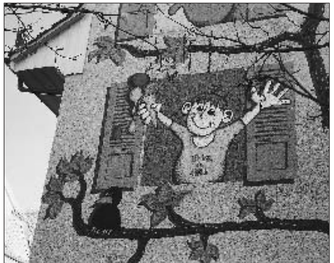
Wo befindet sich dieses Bild?

Einsendetermin ist der 31. Oktober 1998. Vergessen Sie nicht, Ihre Adresse anzugeben. Die Gewinnerin oder der Gewinner wird schriftlich benachrichtigt. Viel Glück!