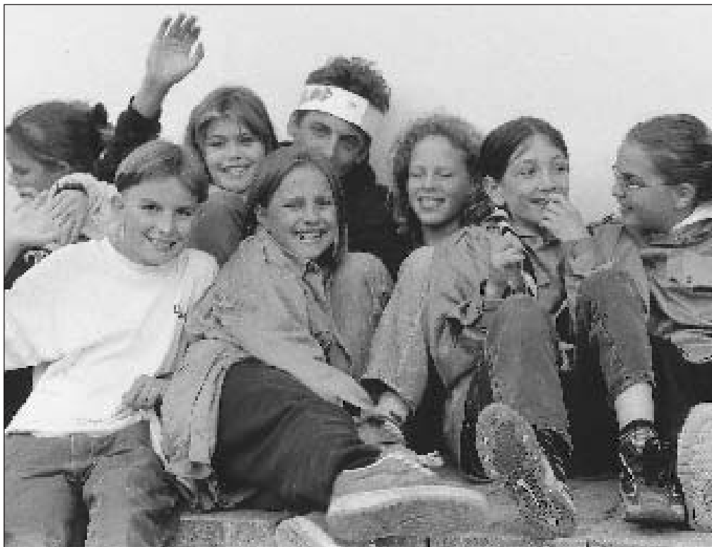
Die Pfadi garantiert für Spiel, Spass und Action.

Wir, die Abteilung Sparta der Pfadi Schwyzerstärn, sind hundert Kinder und Leiter aus dem