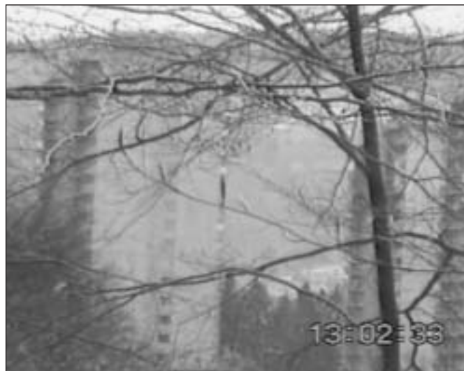
Die Kulisse in und um Wittigkofen eignet sich gut für die Dreharbeiten.

Ein ähnliches Projekt ist nach den positiven Reaktionen von Kindern und Erwachsenen auch 1999 vorgesehen.