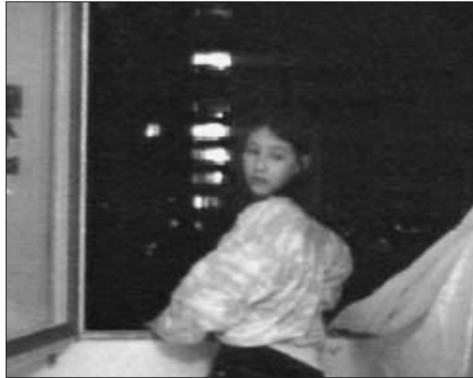
Spannende Abhauszene, gedreht im 5. Stockwerk in Wittigkofen.

Der Altersunterschied der TeilnehmerInnen und die daraus ergebenden Voraussetzungen waren für den Kurs nicht hinderlich, sondern von Vorteil. Es gab keinen Konkurrenzkampf, weder bei der Rollenverteilung noch bei der Ausfüllung der Rollen. Die Kinder und Jugendlichen lernten nicht nur, wie ein Film gemacht wird, sondern auch wie man miteinander umgeht, über Schwächen des andern hinwegsieht und Stärken neidlos anerkennt.