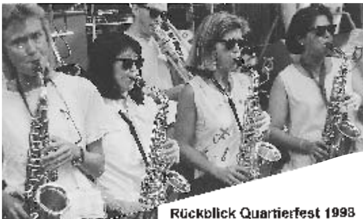
Rückblick Quartierfest 1998